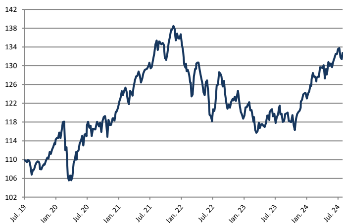
Wertentwicklungen der Vergangenheit sind kein verlässlicher Indikator für die künftige Wertentwicklung.